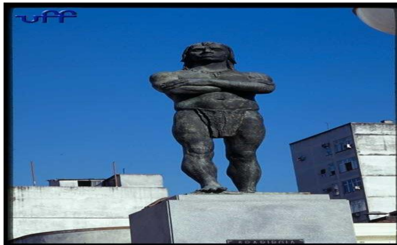
Figura 01 -ESTÁTUA DE ARARIBÓIA – INSTALADA NA PRAÇA - Niterói/RJ.

Alves (2015), capitão da 2ª Brigada de Infantaria do Exército brasileiro, em São Gabriel da Cachoeira descreve como se processou a origem, e as mudanças das Forças Armadas nesta área de fronteira. A 2ª Brigada Infantaria recebeu diversos nomes ao longo de sua história. Mas foi em 17 de junho de 1998 que passa a ser conhecida pelo seu marco histórico, “Brigada Ararigbóia”, através da Portaria Ministerial nº337. Alves (2015) descreve que o nome Ararigbóia foi dado em alusão a um guerreiro da tribo de Termiminós de nome cristão denominado de Martin Afonso de Sousa, cacique respeitado e guerreiro, com lealdade reconhecida pelo Rei de Portugal Dom Sebastião, com o título de Cavaleiro da Ordem de Cristo. Ele esteve envolvido com expulsão dos franceses e o povoamento da cidade do Rio de Janeiro em 1573. Em Niterói foi edificada uma grande estátua do cacique e guerreiro Ararigbóia na Praça das Barcas, constituindo-se num dos maiores monumentos do Município.