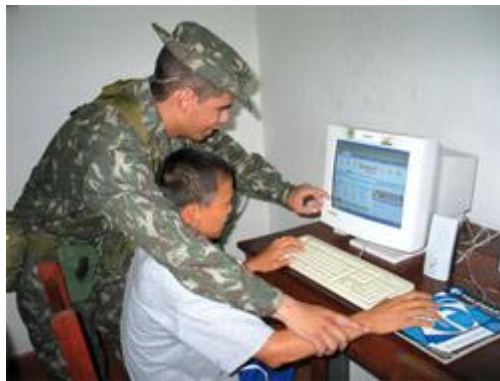
Figura 04: 1 o PEF PALMEIRA DO JAVARI – AM

Como podemos observar na ilustração abaixo, que existe uma troca de conhecimentos ao redor dos Destacamentos, Companhias e PEFs da Amazônia Brasileira, seja ela em pequena ou grande escala, seja ela tecnológica ou rudimentar, visando o bem maior que é o desenvolvimento nessas áreas de difícil acesso com a troca dos saberes nas áreas de educação, saúde e tecnologia.