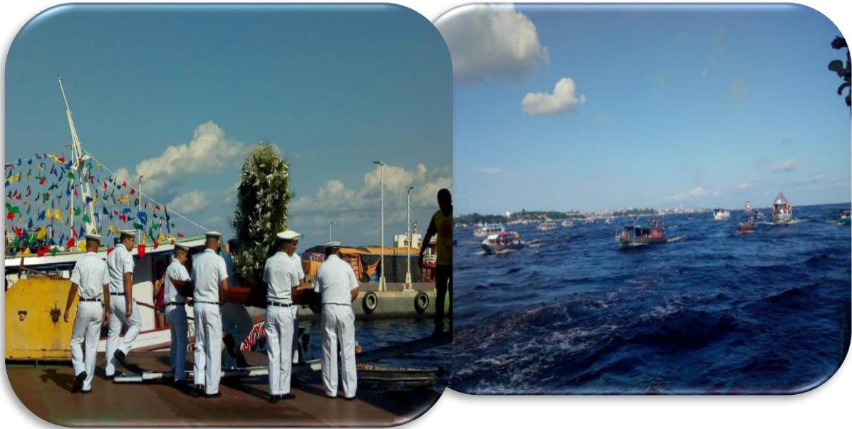
Procissão de São Pedro 2019

A igreja católica do bairro de Educandos, Nossa Senhora do Perpétuo Socorro, realiza anualmente, aos vinte e nove dias do mês de junho, a Festa de São Pedro. Foi na metade do século XX que teve início a Procissão fluvial, comemorando neste 2019 a sua septuagésima edição, segundo o padre que conduzia o barco com o andor do Santo Padroeiro. O tema da festa foi “ Com São Pedro somos todos irmãos ” e lema “ Cuidado com a vida, cuidado com o planeta ”, fazendo alusão à preservação do meio ambiente. A festa religiosa enfatizou momentos de reflexão em tom de um discurso eco religioso, fortalecido com a presença de uma equipe da secretaria de meio ambiente de Manaus (SEMMAS), distribuindo folhetos com orientações para que não fossem jogados lixos no Rio e ainda enfatizando o discurso do padre animador que também clamava ao devotos do santo e às embarcações que se juntavam à procissão, “ vamos cuidar dos rios, vamos cuidar da Amazônia ”.