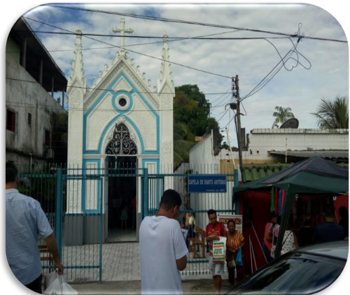
Capela do Pobre Diabo. Dia de Santo Antônio, 2019