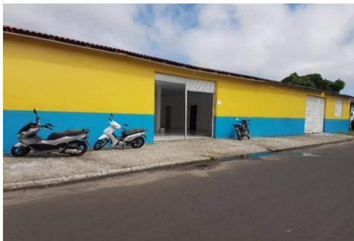
Figura 1. Coordenação de Distribuição de Alimentos

A Coordenação de Distribuição de Alimentos Escolar é a instituição responsável pela distribuição da merenda escolar no município de Parintins – Amazonas. Segundo o último IBGE (2010), o município possui 102.066 habitantes, deste quantitativo cerca de 19.000 alunos são assistidos pela coordenação.