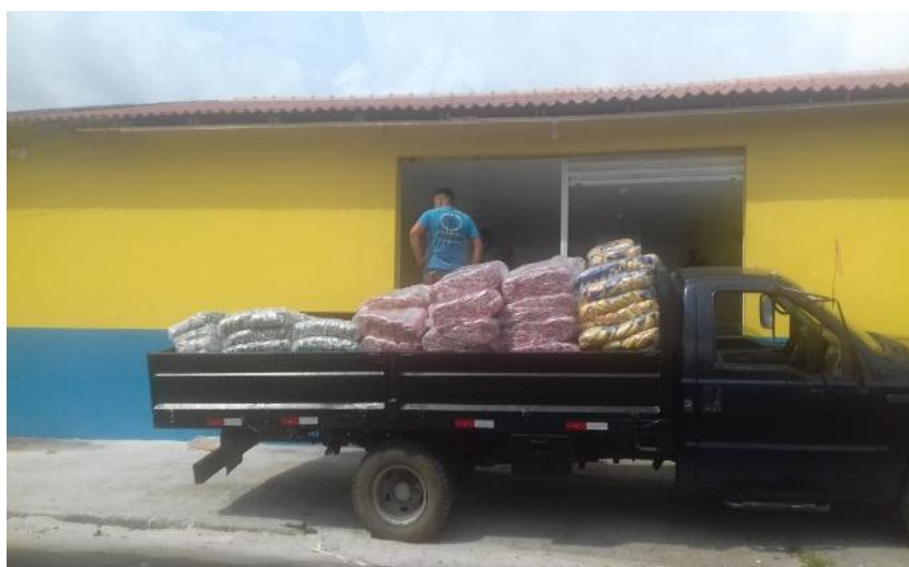
Figura 3. Descarga de alimento perecíveis

Dentro deste contexto, a primeira atividade identificada foi a de recebimento das mercadorias das indústrias fornecedoras de alimentos perecíveis. Esta atividade ocorre durante o período diurno e dá-se quando inicia a jornada do auxiliar administrativo. Este verifica se há caminhões ou carretas em frente ao galpão, existindo este orienta o motorista para descarregar, como aponta a figura 3.