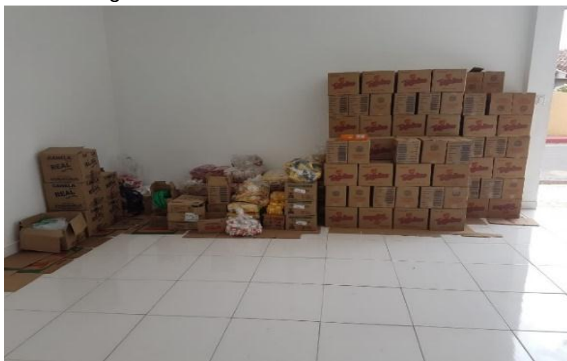
Figura 4. Armazenamento dos alimentos

No momento em que são descarregados os produtos, são verificadas pelo conferente a quantidade e a data de validade em cada caixa, pacote. A retirada das mercadorias do caminhão feita sem o uso de paletes e prateleiras, os produtos são organizados no chão do galpão, como mostra a figura 4.